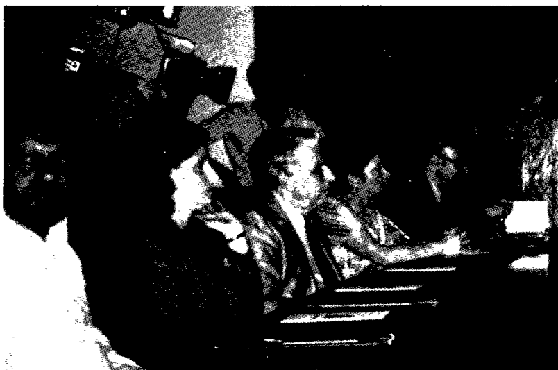
Once de los veinte firmantes son fotografiados en el momento de ofrecer el Manifiesto