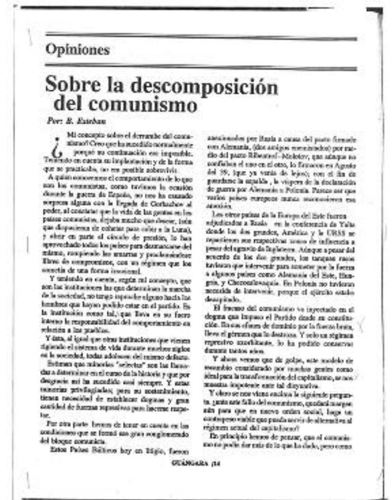
Artículo publicado en la revista Guámgara