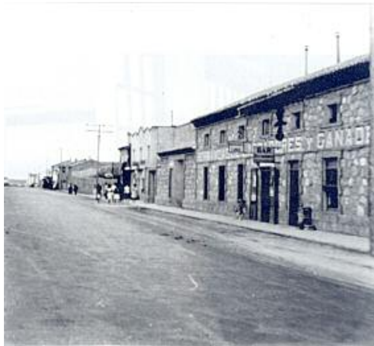
Villarquemado. Sede del Sindicato Obrero Campesino (CNT) en 1936: primer edificio a la derecha.