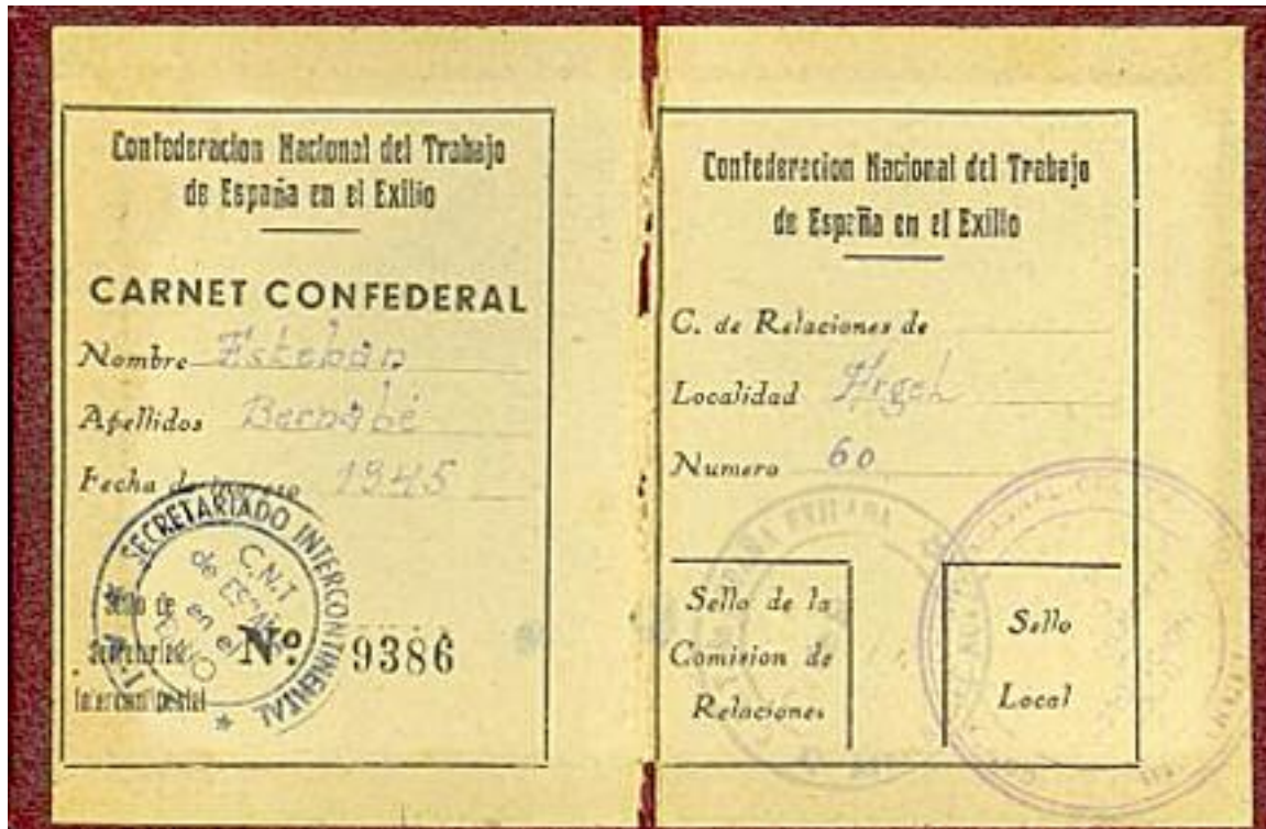
Carnet de la CNT en Argel