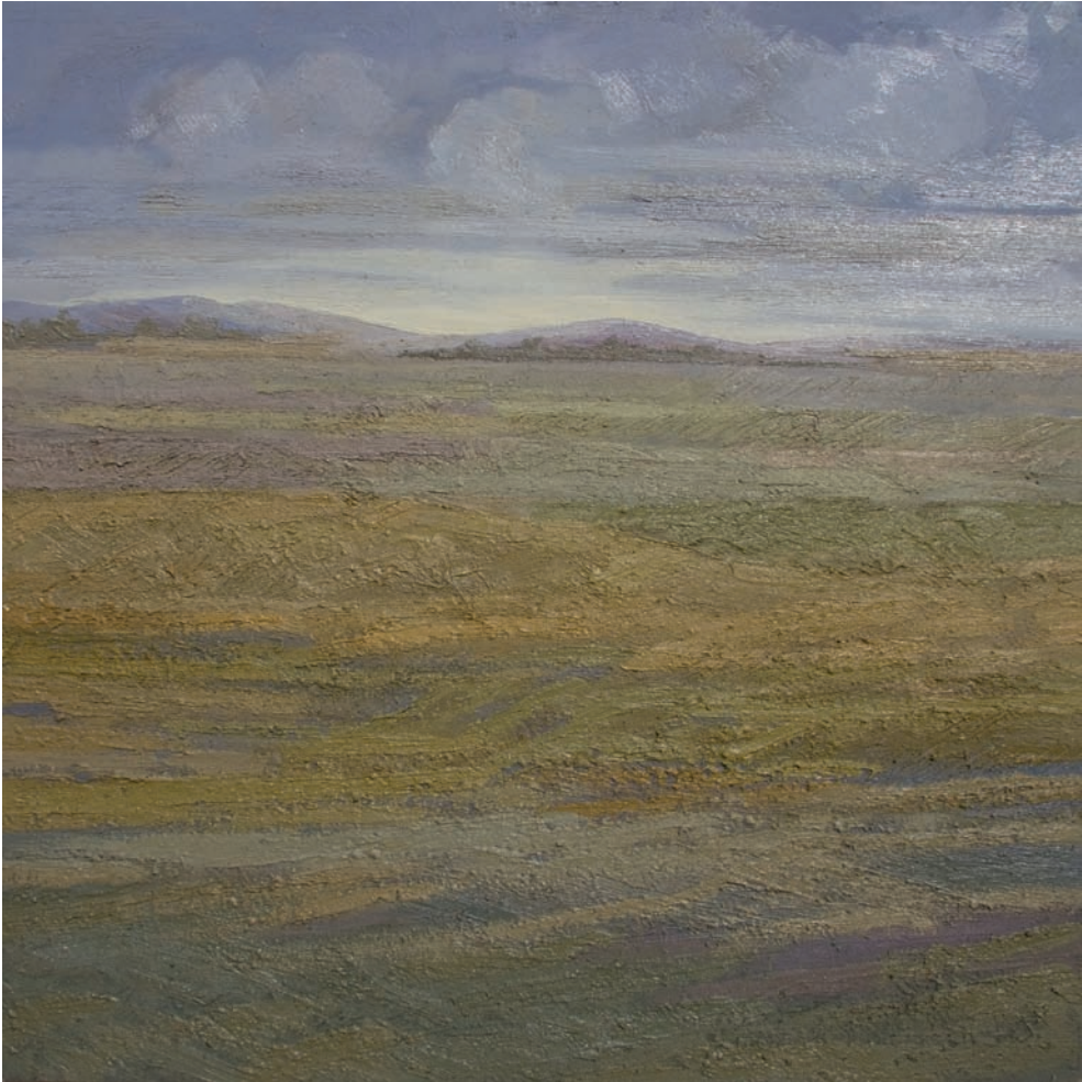
Óleo sobre lienzo 146 x146 cm