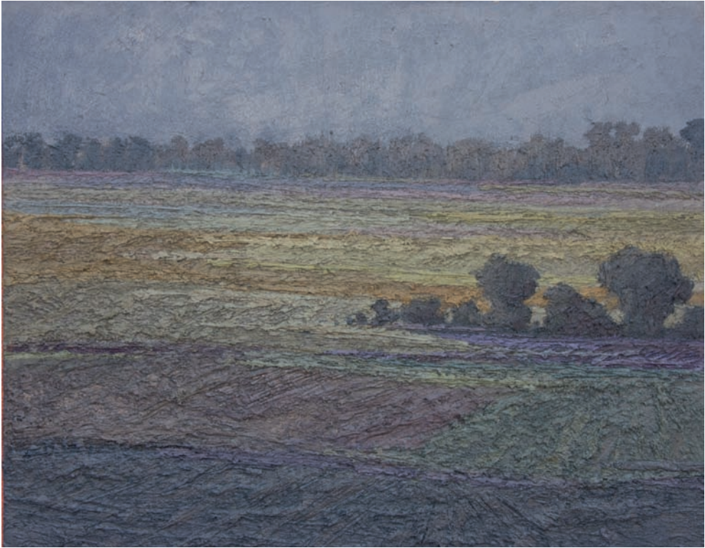
Óleo sobre lienzo 65 x 81 cm