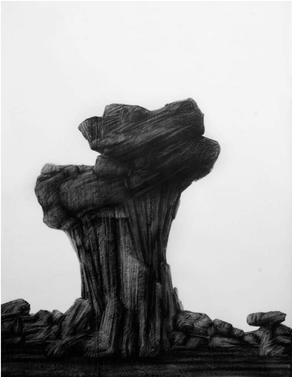
Grafito sobre papel 205 x 150 cm