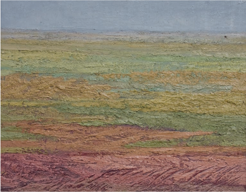
Óleo sobre lienzo 65 x 81 cm